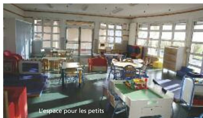
L'espace pour les petits

Cet été, plusieurs sorties sont proposées.