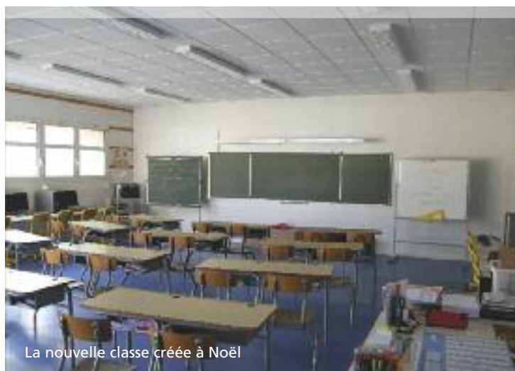
La nouvelle classe créée à Noël

Un PEDT, dont le principal objectif est le bien-être et l'épanouissement de l'enfant, a été élaboré par les élus et les services municipaux en partenariat avec l'Education Nationale, les parents d'élèves et les associations.