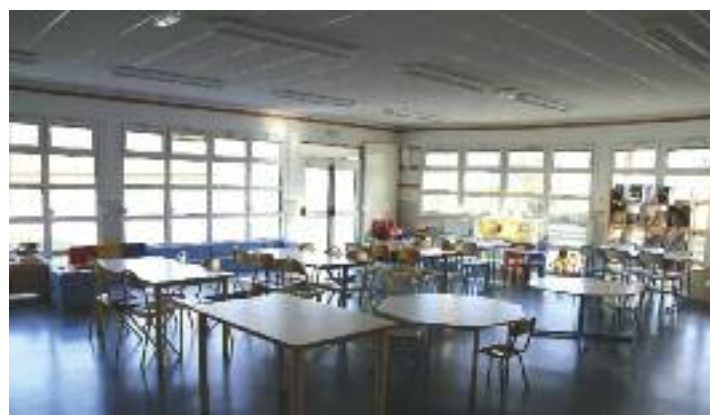
L'espace pour les grands

A ce jour, cette structure permet une prise en charge optimale des enfants qui restent sur le lieu de l'école sans être obligés de faire des transferts dangereux à pieds sur le bord des routes