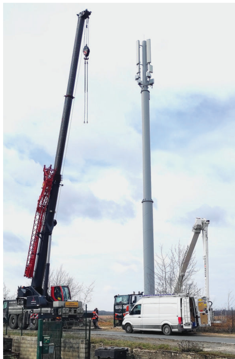
L'antenne a été installée le 7 mars dernier

Ainsi en 2019, nous avons reçu cette bonne nouvelle (4 années plus tard...). Les travaux ont pris beaucoup de retard malgré un suivi très rapproché par Stephane Pochet Maire Adjoint, l'antenne GSM sera mise en service avant cet été.