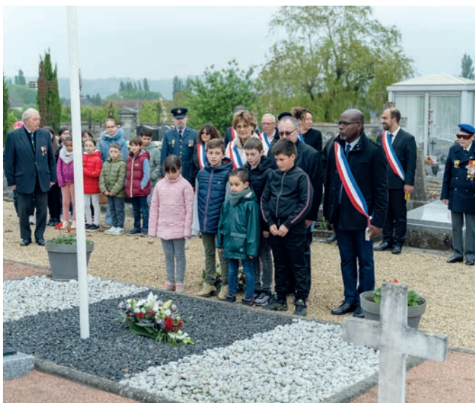
Monument aux morts de Jouarre.

Mercredi 8 mai, la ville de Jouarre a commémoré la victoire des armées françaises et de leurs alliés au monument aux morts de la ville. À 9h, les habitants se sont rassemblés sur le parvis de la mairie et ont défilé en cortège jusqu'au monument aux morts. La cérémonie a débuté par un dépôt de gerbes en hommage à ceux qui ont perdu la vie pour la liberté . Ensuite, des messages ont été lus pour rappeler l'importance historique de cette journée et honorer la mémoire des soldats.